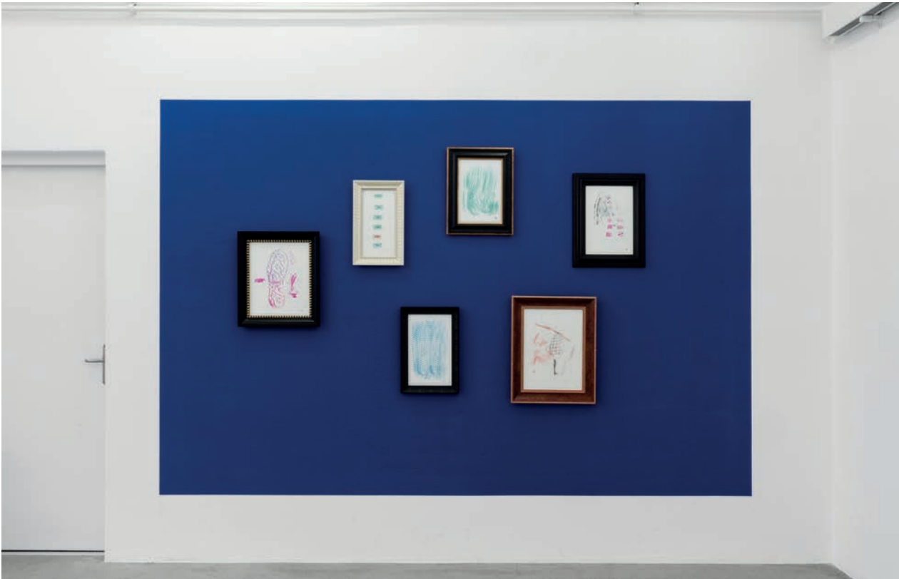
Installationsansicht: Edition Juni - One Wall - Tobias Kaspar: Rented Life