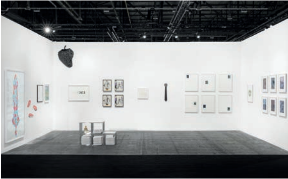
Art Geneve: Edition VFO Stand