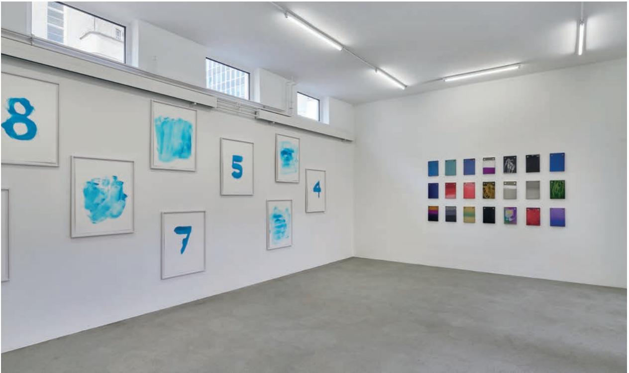
Installationsansicht: Edition September - When Color Becomes Form Mit neuen Arbeiten von Renée Levi und Raphael Hefti